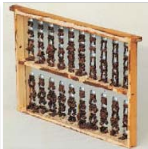
Le propocadre.